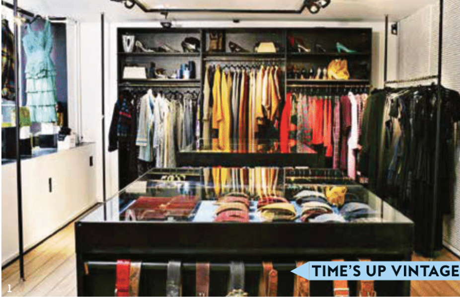
1 TIME'S UP VINTAGE