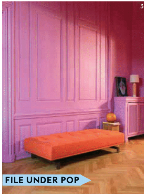
FILE UNDER POP