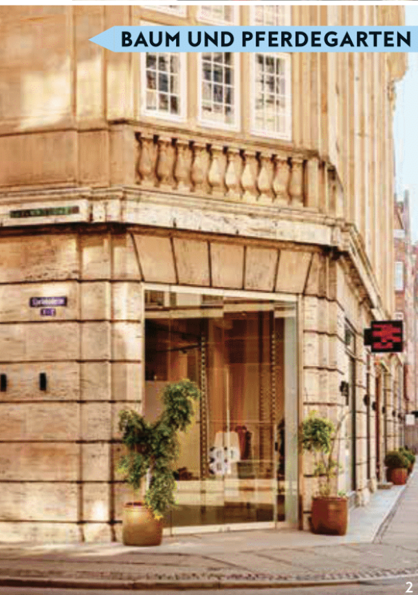
BAUM UND PFERDEGARTEN

1 Time's Up Vintage Hier gibt es Vintageschätze für Männer und Frauen 2 Baum und Pferdgarten Im Flagshipstore finden Sie die neuesten Kollektionen des Design-Duos 3 File Under Pop Hier werden die Träume aller Interior-Fans wahr