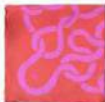
Scarf, Staw Goya, 400 kr