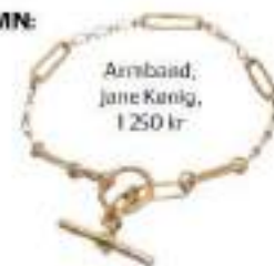
Armband, Jane Knig, 1250 kr