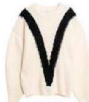
Stickad tröja, Dagmar, 2995 kr