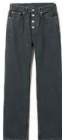
Jeans, Weekday, 500 kr